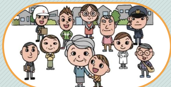
※イラストは帯広市きつきネットワークのチラシより

今回は「圏域相談支援事業」についてのお話をします。当事業所では、日々の生活の中で「どこに相談をしてよいのか分からない」「すぐに困りごとを聞いてほしい」など、様々な悩みや困りごとを抱えている障がいのある方やそのご家族に対しての相談をお受けしています。担当している圏域は「広陽・若葉」「西帯広・開西」の日常生活圏域です。